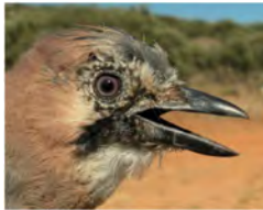
Gaio. Imagem da cabeça e coberturas das primárias.

32-34 cm. Plumagem de cor acastanhada; abdómen claro; coroa estriada de preto e branco; asas escuras com álula e coberturas azuis listadas de negro; coberturas caudais brancas.