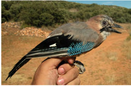
Gaio. Adulto (31-VII).