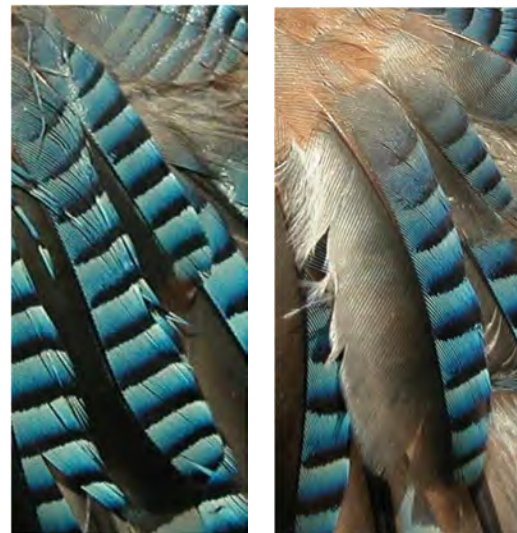
Gaio. Determinação da idade. Número de barras negras na grande cobertura mais externa: esquerda adulto; direita juvenil.

Adultos com a grande cobertura mais externa com mais de 10 barras negras; barras negras das penas azuis repartidas com regularidade; não há limite de muda nas grandes coberturas; o desenho do barrado das grandes coberturas e das grandes coberturas primárias é semelhante; a penúltima pena mais externa da cauda > 25 mm de largura a 40 mm da ponta.