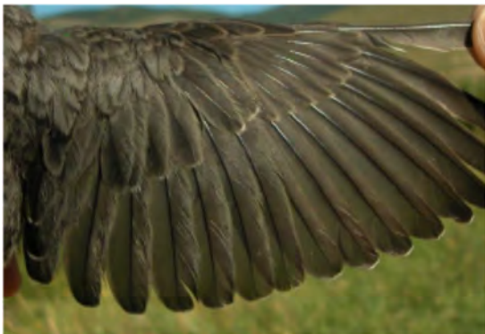
Melro-d'água. Asa de juvenil (08-VII).