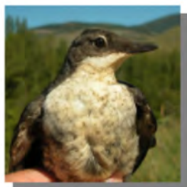
Melro-d'água. Imagem do peito: esquerda adulto (27-XII); direita juvenil (08-VII)