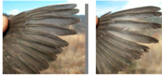
Melro-d'água. Desgaste das primárias no Inverno: esquerda adulto (27-XII); direita 1º ano (27-XII).