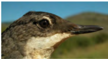
Melro-d'água. Imagem da cabeça e da cor da íris: em cima adulto (08-VII); em baixo juvenil (08-VII).