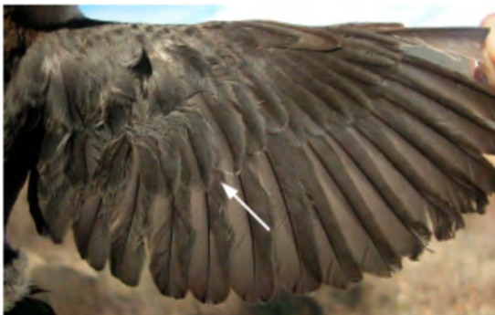
Melro-d'água. Muda pós-juvenil. Asa de 1º ano (27-XII).