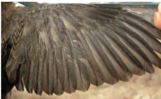
Melro-d'água. Muda pós-nupcial. Asa de adulto (27-XII).