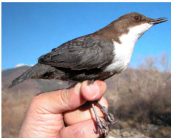
Melro-d'água. Adulto (08-I).