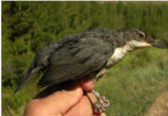
Melro-d'água. Juvenil (08-VII)