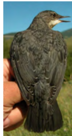
Melro-d'água. Imagem do dorso: em cima à esquerda adulto (27-XII); em cima à direita 1º ano (27-XII); esquerda juvenil (08-VII).