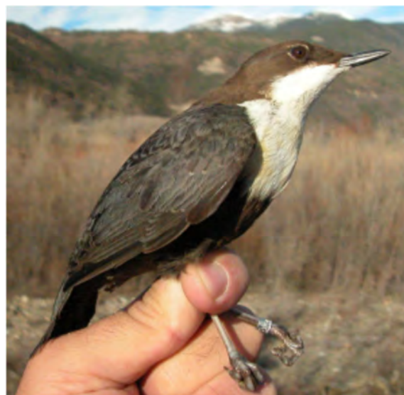
Melro -d'água. 1º ano (27-XII).

Espécie sedentária presente nos troços altos dos rios das montanhas do Norte e Centro.