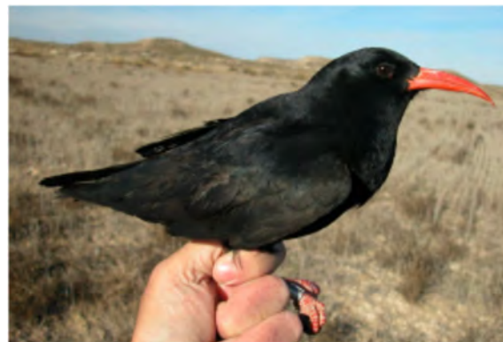
Gralha-de-bico-vermelho. 2º ano (06-I)

É uma espécie essencialmente sedentária, estando presente em algumas zonas de falésias costeiras, em zonas montanhosas rochosas e vales fluviais escarpados.