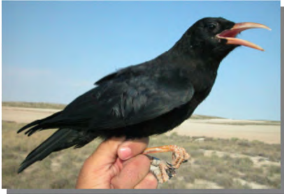
Gralha-de-bico-vermelho. Juvenil (18-VI)