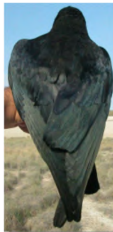
Gralha-de-bico-vermelho. Imagem do dorso: em cima esquerda adulto (06-I); em cima direita 2º ano (06-I); esquerda juvenil (18-VI)