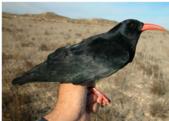
Gralha-de-bico-vermelho. Adulto (06-I).

GRALHA-DE-BICO-VERMELHO ( Pyrrhonorax pyrrhonorax )