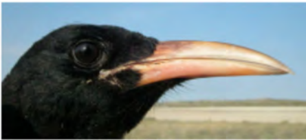
Gralha-de-bico-vermelho. Longitude e cor do bico: em cima macho adulto (06-I); centro fêmea adulta (06-I); em baixo juvenil (18-VI)