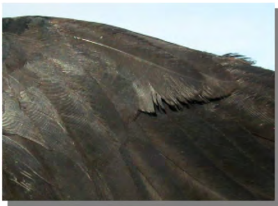
Gralha-de-bico-vermelho. 2º ano: imagem da alula (18-II).