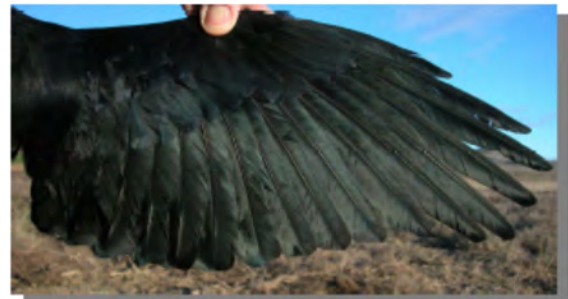
Gralha-de-bico-vermelho. Adulto: imagem da asa (18-II).