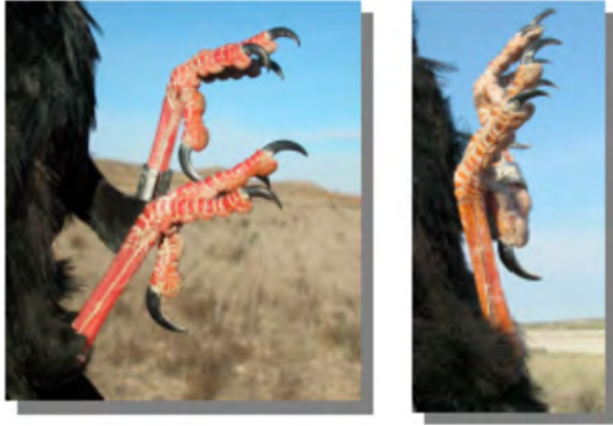
Gralha-de-bico-vermelho. Cor das patas: esquerda adulto (06-I); direita juvenil (18-II)