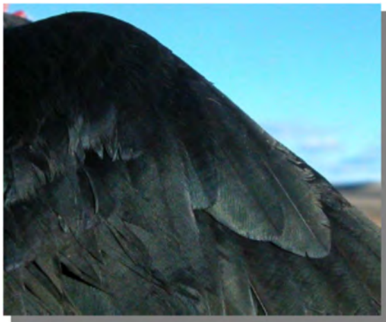
Gralha-de-bico-vermelho. Adulto: imagem da alula (18-II)