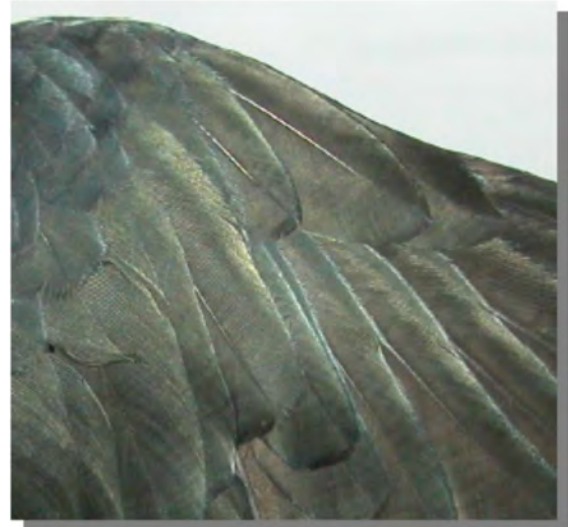
Gralha-de-bico-vermelho. Juvenil: imagem da alula (18-II).