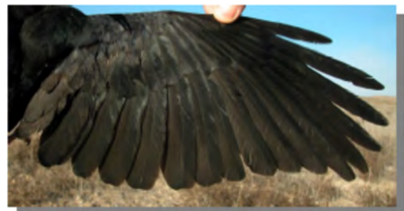
Gralha-de-bico-vermelho. 2º ano: imagem da asa (18-II).