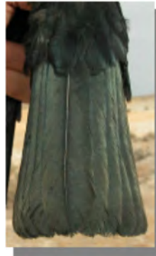
Gralha-de-bico-vermelho. Desgaste da cauda: em cima esquerda adulto (18-II); em cima direita 2º ano (06-I); esquerda juvenil (18-VI)