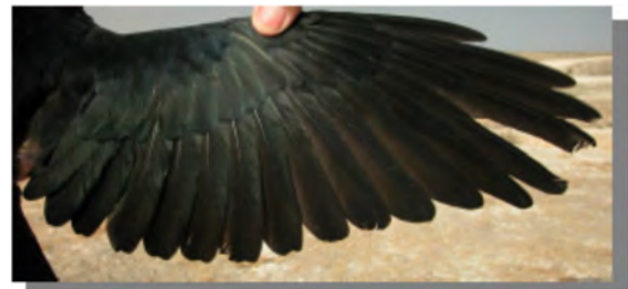
Gralha-de-bico-vermelho. Juvenil: imagem da asa (18-II).